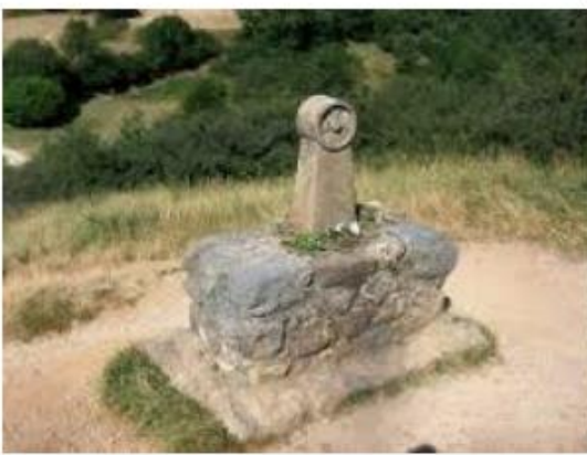
Pequeño monumento con Ancla de Luz