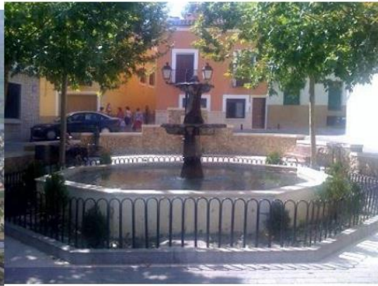
Centro de la ciudad de Huete.

Después de esto, su trabajo se habrá completado y usted podrá continuar sus vacaciones.