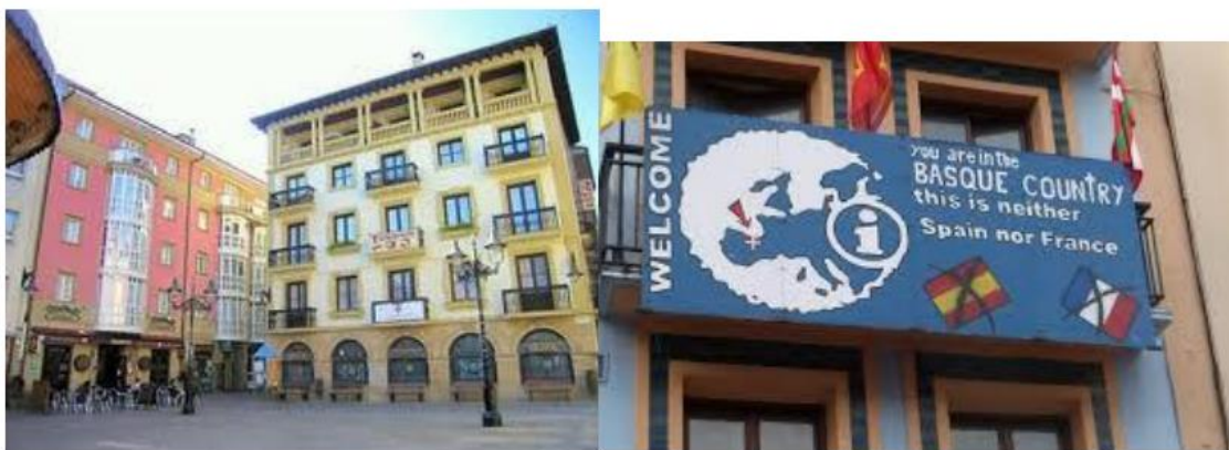
Hotel en Zarautz

De repente dos personas vinieron a nosotros preguntando qué estábamos buscando y como era tan tarde les preguntamos dónde había hoteles cerca del mar. Nos dijeron que continuáramos a Zarautz sólo a 10 minutos en coche de allí - sólo un poco más, como por casualidad. Terminamos encontrando un hotel para las 5 personas en Zarautz alrededor de una plaza con un quiosco y fue sólo al día siguiente que vi la gran señal en una casa alrededor de esa plaza: "Estás en el País Vasco, esto no es ni España ni Francia "con su oficina política en el primer piso. Los celestiales tuvieron éxito al llevarnos exactamente donde teníamos que estar... increíble pero cierto.