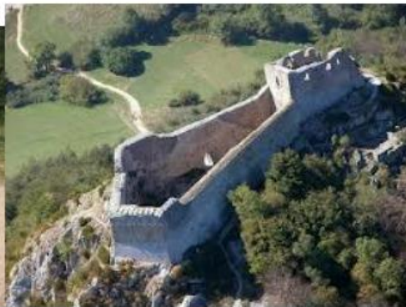
Castillo de Montsegur.

Deben dirigirse a un lugar donde hay un pequeño monumento que conmemora la estaca donde 250 cátaros fueron quemados vivos. Muchas personas han sido