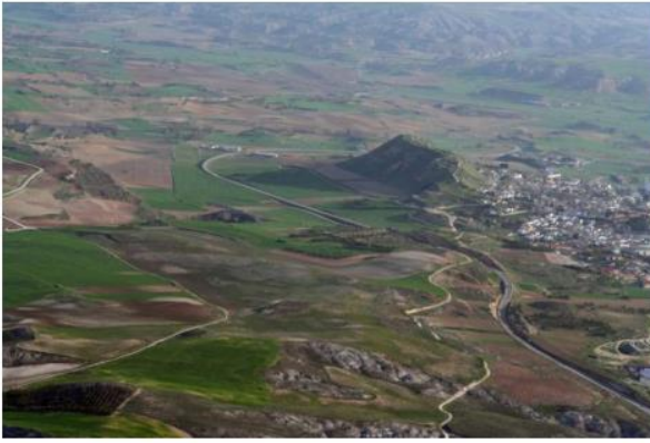
Recuperación de datos casi en la montaña superior